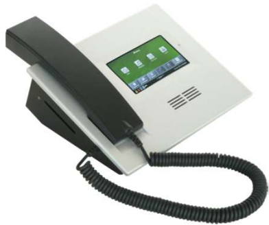
Cornetta per Telefono PSTN/IP radio tattica