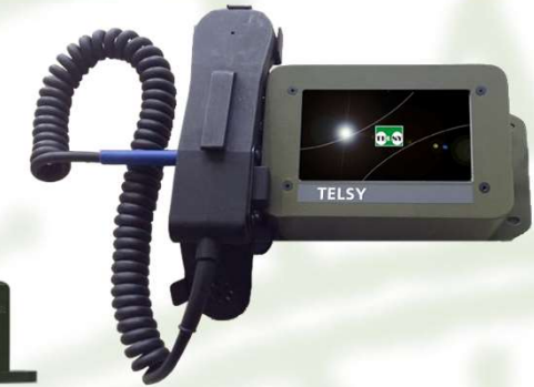
Unità Tattica Voce